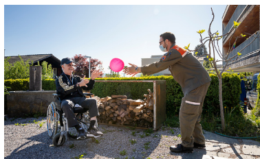
Betreuer mit Bewohner einer Alters-einrichtung.

Während der ersten und zweiten Covid-Welle haben wir sehr viele Einsätze gehabt, haben die Hotline und das Contact Tracing unterstützt, haben im See-Spital, diversen Heimen und Behinderteneinrichtungen ausgeholfen. Gerade in den Altersheimen, als diese für sämtliche Besucher geschlossen wurden, haben wir grosse Dienste geleistet ... Das war wohl der grösste